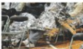
東日本大震災の発生地、津地でできる熱心の避難所で防寒シートにくるまる人々

避難した体育館でくるまっている人たちの写真が新聞にも掲載されていました。安いものは数百円、小さく畳めますから持ち運びにも便利です。